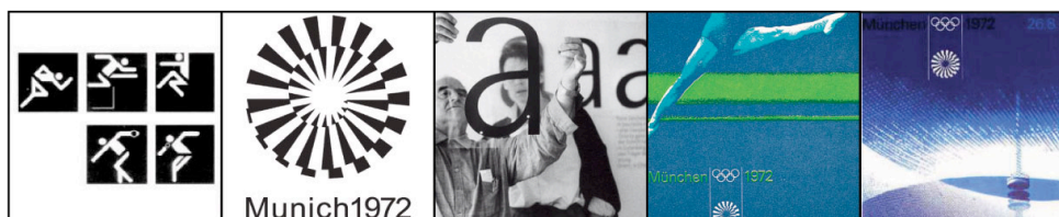
Fig. 1.2 - Signos Identificadores de Sistemas de Identidade Corporativa, realizados por Otl Aicher.

Nenhuma Instituição prescinde hoje de um signo gráfico como Identificador Institucional e o próprio conceito de Identidade Corporativa está quase exclusivamente associado ao Sistema de Identificação Gráfica das Instituições. Neste contexto a sua importância social e cultural, leva-nos ao estudo e análise dos Signos Identificadores (características verbais e visuais dos signos) como uma das ferramentas protagonizadoras, na análise da Identificação Institucional.