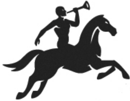
Fig. 1.9 - Símbolo dos Correios de Portugal

Os símbolos representam uma imagem ou referente, que é reconhecível pelo observador pela sua semelhança formal e evidente do mundo real ou imaginário (Fig. 1.9);