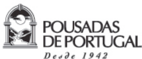
Fig. 1.12 - Símbolo das Pousadas de Portugal

Todos os tipos de símbolos aqui expostos, podem ainda materializar-se com outros elementos gráficos, como fotografias, elementos mais ou menos orgânicos, pictóricos ou geométricos e ser ainda combinados com os tipos de logótipos descritos anteriormente (Fig. 1.12).