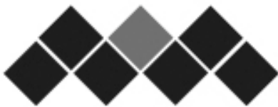
Fig. 1.10 - Símbolo do Instituto Português de Museus

Os símbolos não representam objectos ou conceitos conhecidos, e podem através das suas características formais ou cromáticas, conotar algum tipo de sensação como, suavidade, movimento, modernismo, fragilidade, força, etc. (Fig. 1.10);