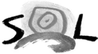
Fig. 1.6 - Logótipo do semanário Sol - Portugal

A substituição de alguma letra do logótipo por um ícone formalmente compatível com a dita letra ou com a actividade da empresa (Fig. 1.6);